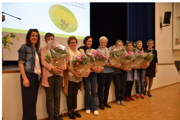
HV 2022 Ehrungen

Danke von Herzen für diese Treue und das riesige Engagement.